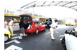
2015年7月にオープンした西古松局(岡山市北区)

■環境省主催「第4回グッドライフアワード」 環境と循環部門で市民参加型集積プロジェクト 「えこ便」が実行委員会特別賞受賞