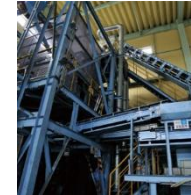
世界初の自動化された 固気流動層式アルミ選別装置