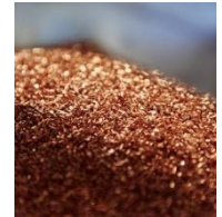
日本とヨーロッパの技術コラボ 不純物を徹底除去して銅を資源化