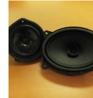
素材はヒラキン発のリサイクルPP 世界上位シェアの車載スピーカー

弊社の強みである「技術開発部」 精緻なリサイクルを実現するためにオリジナルの設備とノウハウを生み出す。