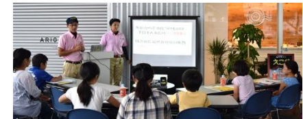
毎年開催している「子どもリサイクル教室」