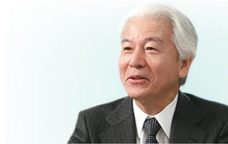
エコプレミアムクラブ会長

その次に問題になったのが、廃棄物の最終処分地の問題でした。2000年にできた循環型社会形成推進基本法のお蔭か、1991年には1億1千万トンあった埋め立て量は、平成23年度には1244万トンと1/9に減少しています。ゴミを出さない日常生活と産業構造、リユースを徹底して何度も使う、リサイクルは高度な水平リサイクル、この3点が今後の方向性です。