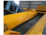
金属センサー選別