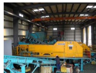
マイクロシュレッダープラント