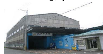
愛媛オートリサイクル

高リサイクル率の追求 (ゼロエミッションを目指して推進する) 低コストリサイクルの追求 (ユーザーにリサイクルを通じてのコストダウンを提案する)