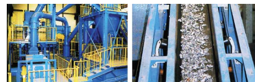
マルチシュレッダープラント