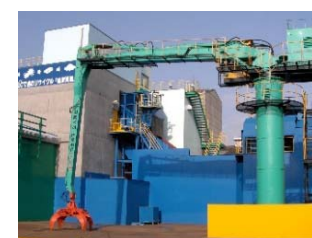
メタルシュレッダープラント