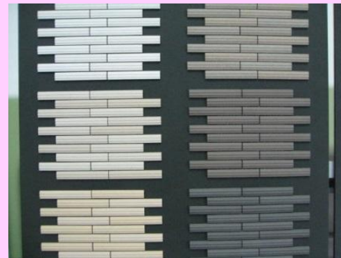
戸建住宅用タイル