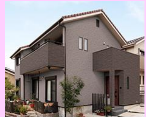
戸建住宅への施工例